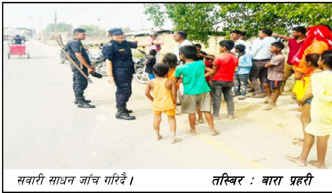
सवारी साधन जाँच गरिदै।

कारवाही स्वरूप प्रहरीले ८८ हजार ५ सय रुपैयाँको राजश्व