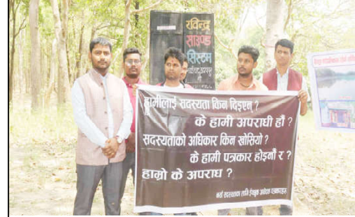
व्यानर बोकेका सञ्चारकर्मीहरू प्रदर्शन गर्दै।

उनीहरूले हामीलाई सदस्यता किन दिइएन ? के हामी